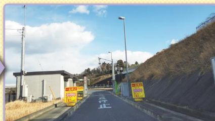
3 ゲートの手前で必ず一旦停止