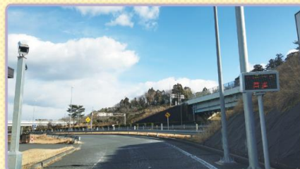
4 ゲートが開いたら、直進して新空港自動車道に合流