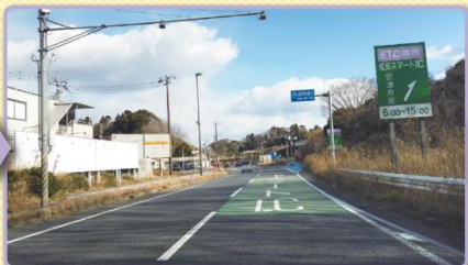
2 緑色のカラー舗装が見えてきたら、まもなく右側に分岐