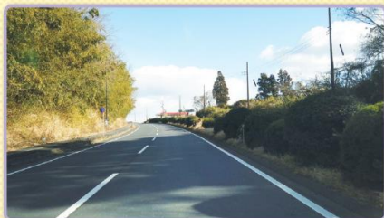
1 成田スマートIC利用時は右車線を走行