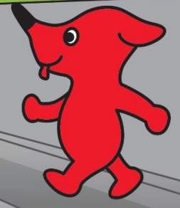
千葉県 マスコットキャラクター チーバくん