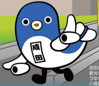
成田市 観光キャラクター うなりくん ©成田市2009